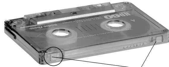
Orejetas de protección contra borrado

Las cintas de casete disponen de dos orejetas de protección contra borrado, una para cada lado. Cuando una orejeta está en su lugar, puede grabarse en ese lado. Para evitar el borrado de una grabación, con un destornillador retire una o ambas orejetas de protección contra borrado. De esta manera se evita oprimir el botón RECORD . Si posteriormente decide grabar en un lado después de haber retirado la orejeta de protección contra borrado, coloque un pedazo de cinta de plástico resistente sobre el orificio de protección contra borrado de ese lado. Cubra solamente el orificio originalmente cubierto por la orejeta. Retirándose las orejetas de protección contra borrado no se impide que un borrador en serie borre la cinta de casete.